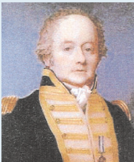
■ William Bligh is toch vooral bekend als Captain Bligh , de graad die hij had ten tijde van de alomgekende Bounty muiterij (Wikipedia)