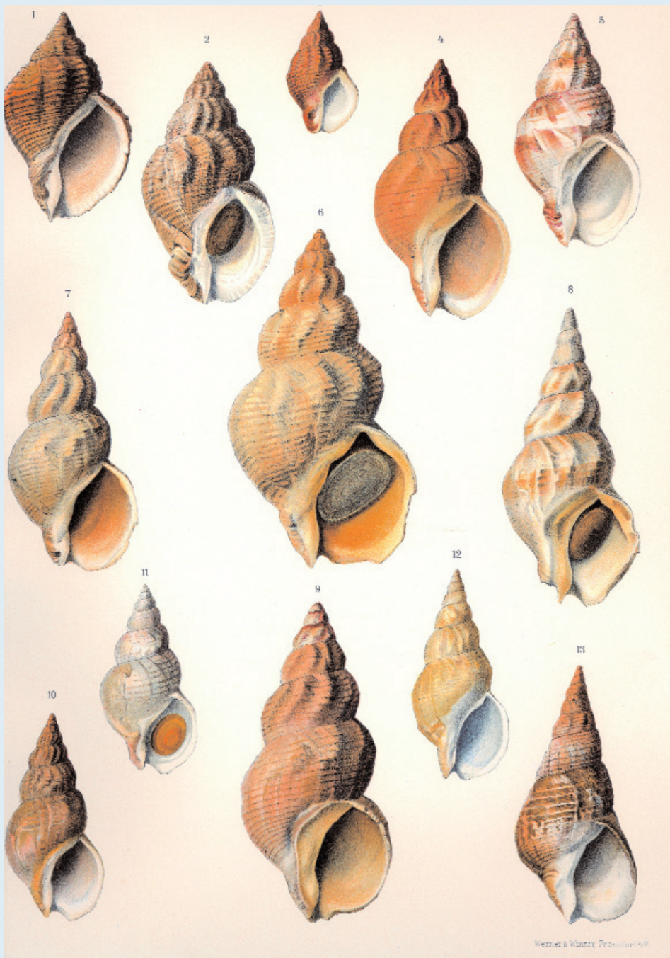
■ De wulk is één van de grootste slakken van de Belgische kust. De vrij bolle, kegelvormige schelp kan tot 12cm lang worden, en is zeer variabel van vorm en kleur (bron: Dautzenberg & Fisher 1912)

Als eetbaar weekdier wordt de wulk al eeuwenlang commercieel bevestigd en tegenwoordig vaak als een delicatessen verkocht. Vroeger was het nochtans armemensenkost, vooral voor de kustbewoners en vissers zelf. Vandaag prijken wulkgerechten op de menukaarten van de slijkste restaurants in Brugge, Gent en Brussel. Of ze daar ook wulkensoep aanbieden is niet bekend, maar in 1884 maakten ze die zo: "Was de wulken goed, kook ze en haal ze uit de schelp. Neem 250 gram boter, met fijngesneden look, een ui, veel peper en wat zout, doe